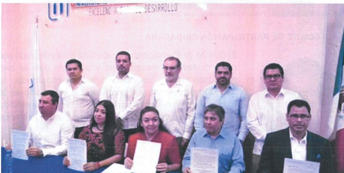
figura 2.1 Designación de los Integrantes del Comité de Participación Ciudadana.

El Comité de Participación Ciudadana tiene como objetivo coadyuvar, en términos de la Ley en la materia, al cumplimiento de los objetivos del Comité Coordinador, y es la instancia de vinculación con las organizaciones sociales y académicas relacionadas con las materias en combate a la corrupción.