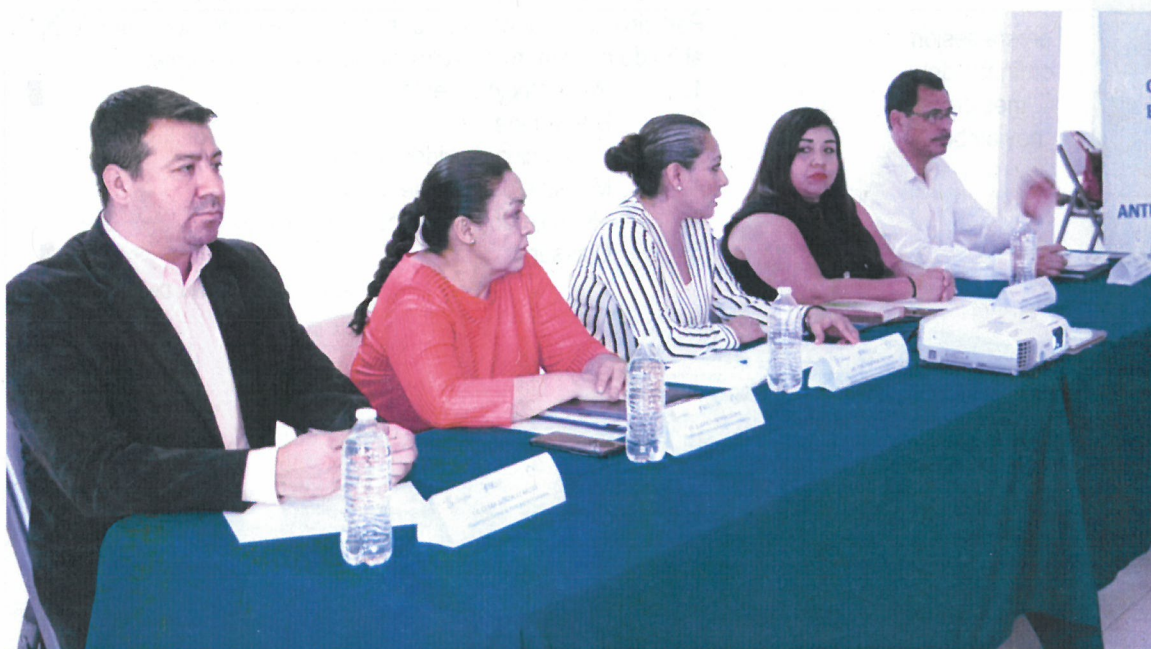
figura 3.6 Sesión de instalación de la Comisión Ejecutiva.