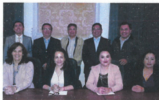
figura 4.10 Reunión regional Puebla-Tlaxcala-Oaxaca-Guerrero.

Foro Municipios y el Sistema Estatal Anticorrupción de Guerrero, organizado por el Comité de Participación Ciudadana con el apoyo de las seis dependencias que conforman el Comité Coordinador. El foro se llevó a cabo en el auditorio Héctor Dávalos de la Universidad Americana de Acapulco el 20 de mayo de 2019.