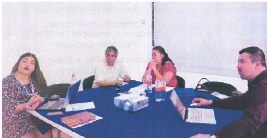
figura 3.5 Sesión del Comité de Participación Ciudadana.