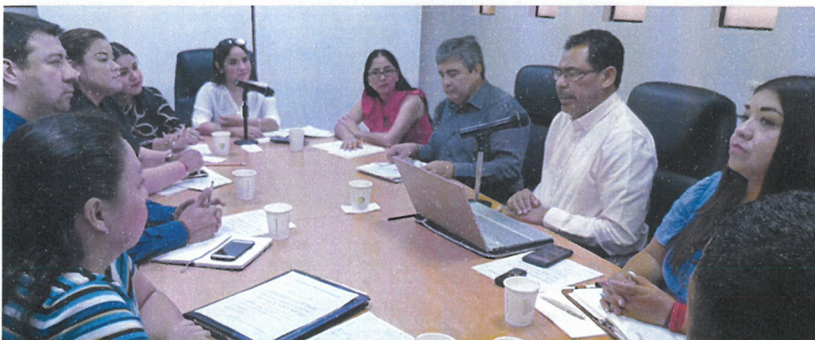
figura 4.14 Reunión de trabajo con los diputados locales que integran la Comisión de Transparencia y Acceso a la Información del Congreso del Estado.

Reunión de trabajo con los diputados locales que integran la Comisión de Transparencia y Acceso a la Información del Congreso del Estado. Acordaron la articulación de una agenda conjunta, que incluyó la organización de dos foros de consulta dirigidos a la ciudadanía con el propósito de acopiar propuestas de reformas a la Ley 207 y el intercambio de experiencias con los Comités de Participación Ciudadana del sur y centro del país. La reunión se realizó el 5 de noviembre del 2019.