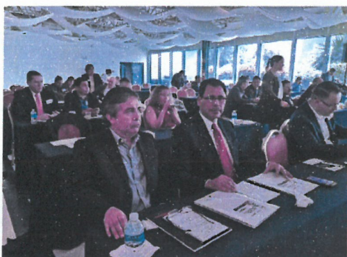
figura 4.7 Reunión de la Red Nacional de Comités de Participación Ciudadana. Fuente: CPC Guerrero