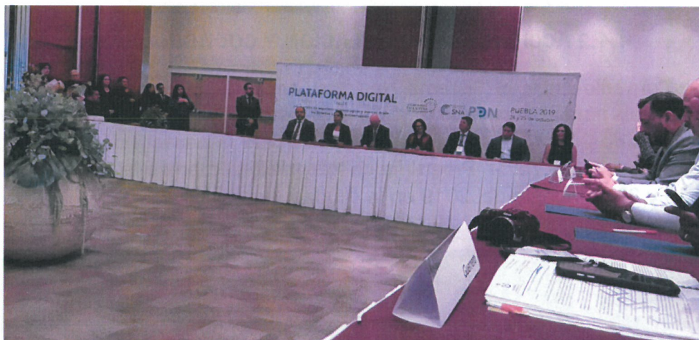
figura 4.21 Firma de Convenio de Colaboración entre las secretarías ejecutivas de los estados de Puebla y Guerrero.