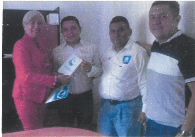
figura 4.4 Entrega del Compendio Legislativo a los directivos del IUIE campus Tlapa.