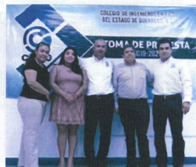
figura 4.12 Firma del Convenio de colaboración con el Colegio de Ingenieros.

Presentación del Modelo Estándar Ético para las Universidades y Centros de Enseñanza Superior, con la participación del Presidente del Comité de Participación Ciudadana del Sistema Nacional Anticorrupción, José Octavio López Presa; donde participaron las siguientes instituciones: Universidad Americana de Acapulco, Universidad Autónoma de Guerrero, Universidad Hipócrates, Universidad Loyola del Pacífico, los Institutos Tecnológicos de Chilpancingo, Acapulco y Región Norte de Guerrero, así como el CONALEP. Realizado el 20 de agosto del 2019.