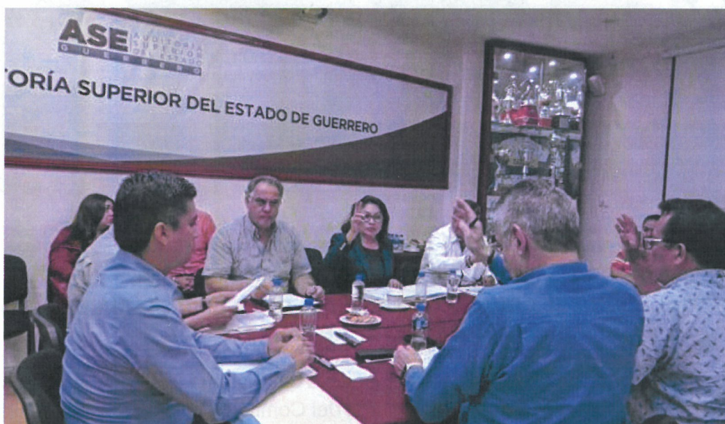
figura 2.5 Sesión de Instalación del Órgano de Gobierno de la Secretaría Ejecutiva del Sistema Estatal Anticorrupción de Guerrero.

De acuerdo con la Ley número 690 de Entidades Paraestatales del Estado de Guerrero, en su artículo 17 Fracción XII, se establece que el Órgano de Gobierno aprobará el Reglamento Interior, manuales de operación y procedimientos que correspondan a la Secretaría Ejecutiva del Sistema Estatal Anticorrupción de Guerrero, para su correcto funcionamiento.