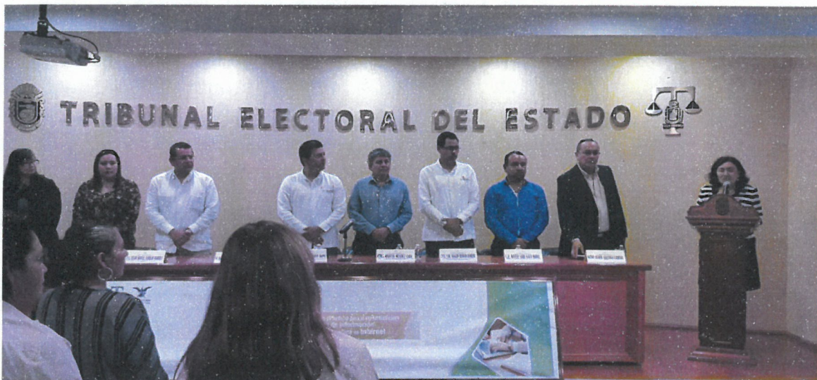
figura 4.17 9a Jornada Gubernamental.

9a Jornada Gubernamental , organizada por el Colegio de Contadores Públicos del Estado de Guerrero, realizada los días 10 y 11 de octubre del 2019, en las instalaciones del Tribunal Electoral del Estado de Guerrero, en la ciudad de Chilpancingo.