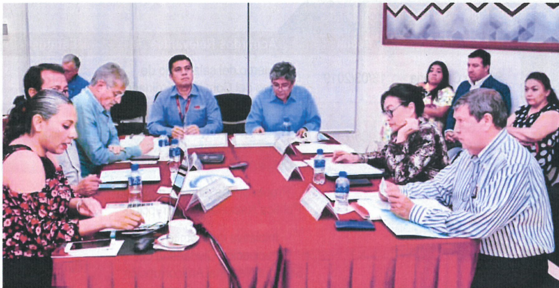
figura 3.2 2da Sesión Ordinaria del Comité Coordinador.