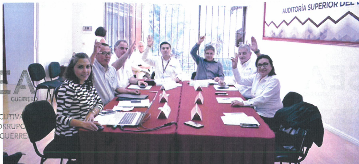
figura 3.3 1ra Sesión Ordinaria del Órgano de Gobierno.

El Órgano de Gobierno celebra por lo menos cuatro sesiones ordinarias por año, además de las extraordinarias que se consideren necesarias; así lo marca el artículo 28 de la Ley número 464 del Sistema Estatal Anticorrupción, por lo que se llevaron a cabo dos sesiones ordinarias y tres extraordinarias durante el período comprendido de marzo a noviembre de 2019, en las que se aprobó un total de seis acuerdos.