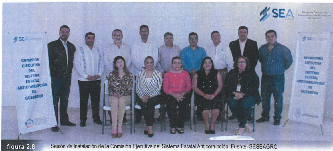
figura 2.8 Sesión de Instalación de la Comisión Ejecutiva del Sistema Estatal Anticorrupción.

La Comisión Ejecutiva tiene entre otras atribuciones, las de generar los insumos técnicos necesarios para que el Comité Coordinador realice sus funciones, debiendo entre otros someter a la aprobación de dicho Comité: