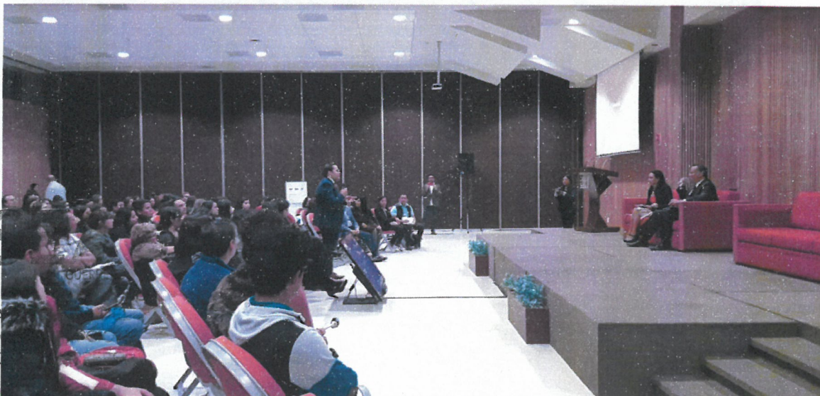
figura 4.18 Conversatorio "Mujeres y la Lucha Anticorrupción: una perspectiva desde la escala local".

Conversatorio "Mujeres y la Lucha Anticorrupción: una perspectiva desde la escala local" , organizado por el Comité de Participación Ciudadana del Estado de México, en las instalaciones de la Facultad de Estudios Superiores de Acatlán Estado de México, el día 18 de octubre del 2019.