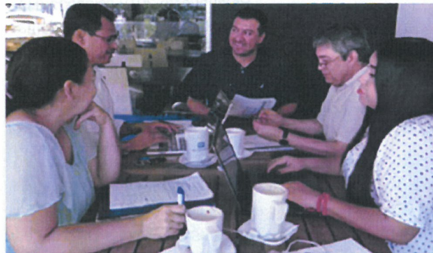
figura 3.4 Sesión del Comité de Participación Ciudadana.

Las reuniones periódicas del Comité de Participación Ciudadana han sido la columna vertebral para la articulación de actividades. Prácticamente al día siguiente de recibir su nombramiento, los integrantes del órgano ciudadano se reunieron para iniciar su planeación e intercambiar puntos de vista sobre la forma de trabajar. Desde entonces, se han realizado varias reuniones formales, además de numerosas informales de las que no fue necesario levantar minuta.