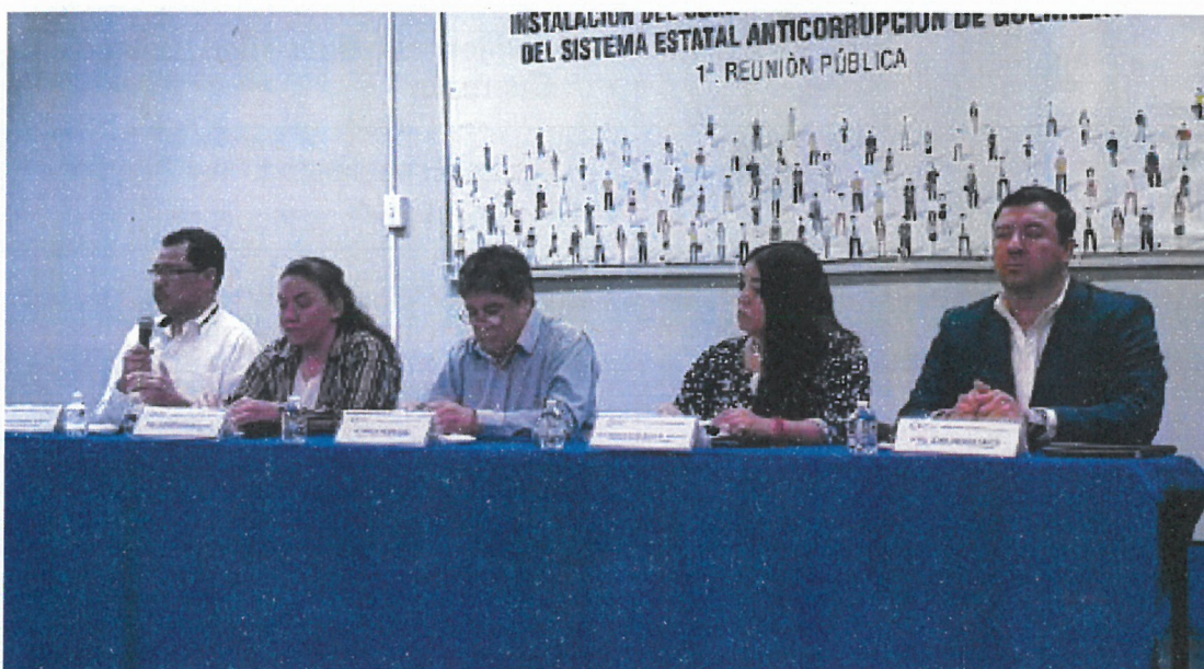
figura 2.2 Sesión de instalación del Comité de Participación Ciudadana.

El 9 de enero del 2019 se celebró en el auditorio del Instituto Tecnológico de Chilpancingo la sesión pública de instalación del Comité de Participación Ciudadana, en la que estuvieron presentes representantes de la sociedad civil, la academia y como invitados especiales los integrantes del Comité Coordinador del Sistema Estatal Anticorrupción de Guerrero.