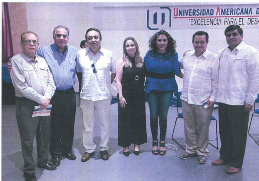
figura 4.16 Conversatorio "Las obligaciones de las empresas ante la responsabilidad penal de las personas morales y la extinción de dominio".

Conversatorio "Las obligaciones de las empresas ante la responsabilidad penal de las personas morales y la extinción de dominio" , presidido por el Consejo de Políticas Públicas en coordinación con la Fiscalía Especializada en Combate a la Corrupción. La sede tuvo lugar en el auditorio Guillermo Soberón de la Universidad Americana de Acapulco el jueves 26 de septiembre del 2019, en la Ciudad y Puerto de Acapulco.