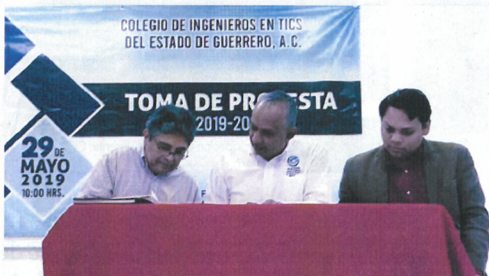
figura 4.11 Firma del Convenio de colaboración con el Colegio de Ingenieros.

Firma del Convenio de colaboración entre el Comité de Participación Ciudadana y el Colegio de Ingenieros en Tecnologías de Comunicación e Información del Estado de Guerrero. Con el objetivo de que el Colegio apoye con todo lo referente a la creación de redes sociales, plataformas electrónicas y otras actividades tecnológicas en beneficio del Comité de Participación Ciudadana. El acto de firma se llevó a cabo el 29 de mayo del 2019.