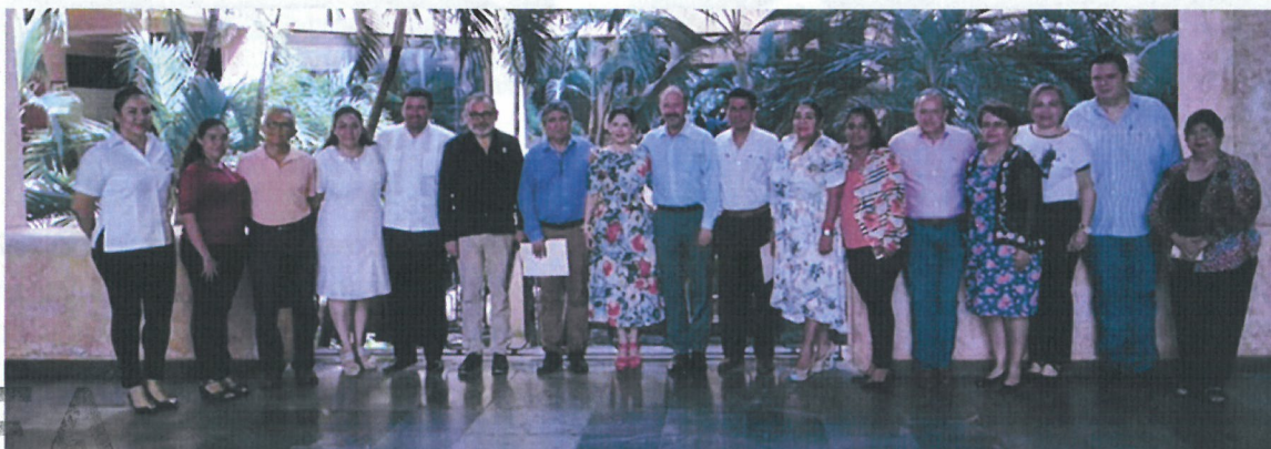
figura 4.13 Presentación del Modelo Estándar Ético para las Universidades y Centros de Enseñanza Superior.

Presentación del Modelo Estándar Ético para las Universidades y Centros de Enseñanza Superior, con la participación del Presidente del Comité de Participación Ciudadana del Sistema Nacional Anticorrupción, José Octavio López Presa; donde participaron las siguientes instituciones: Universidad Americana de Acapulco, Universidad Autónoma de Guerrero, Universidad Hipócrates, Universidad Loyola del Pacífico, los Institutos Tecnológicos de Chilpancingo, Acapulco y Región Norte de Guerrero, así como el CONALEP. Realizado el 20 de agosto del 2019.