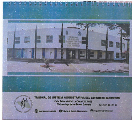
figura 4.5 Calendario 2020 del Tribunal de Justicia Administrativa del Estado de Guerrero.